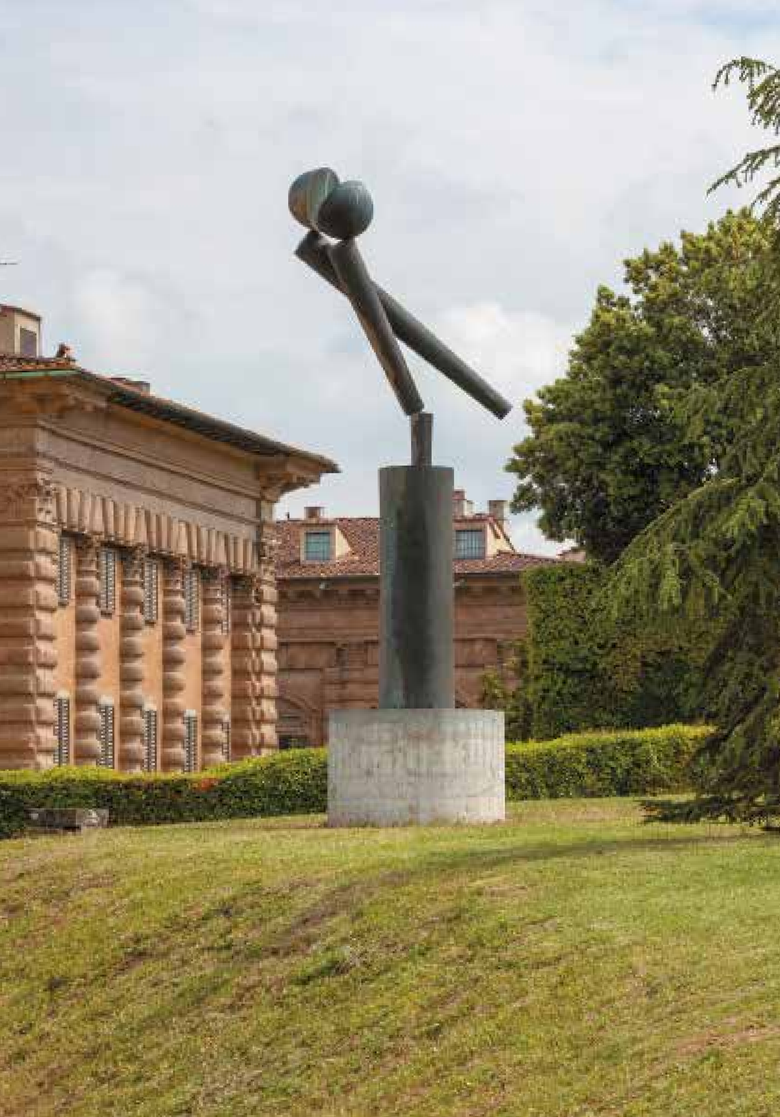
Große Zwei IX Grande coppia IX 1975 (50) Große Zwei XVIII Grande coppia XVIII 1976 (51)