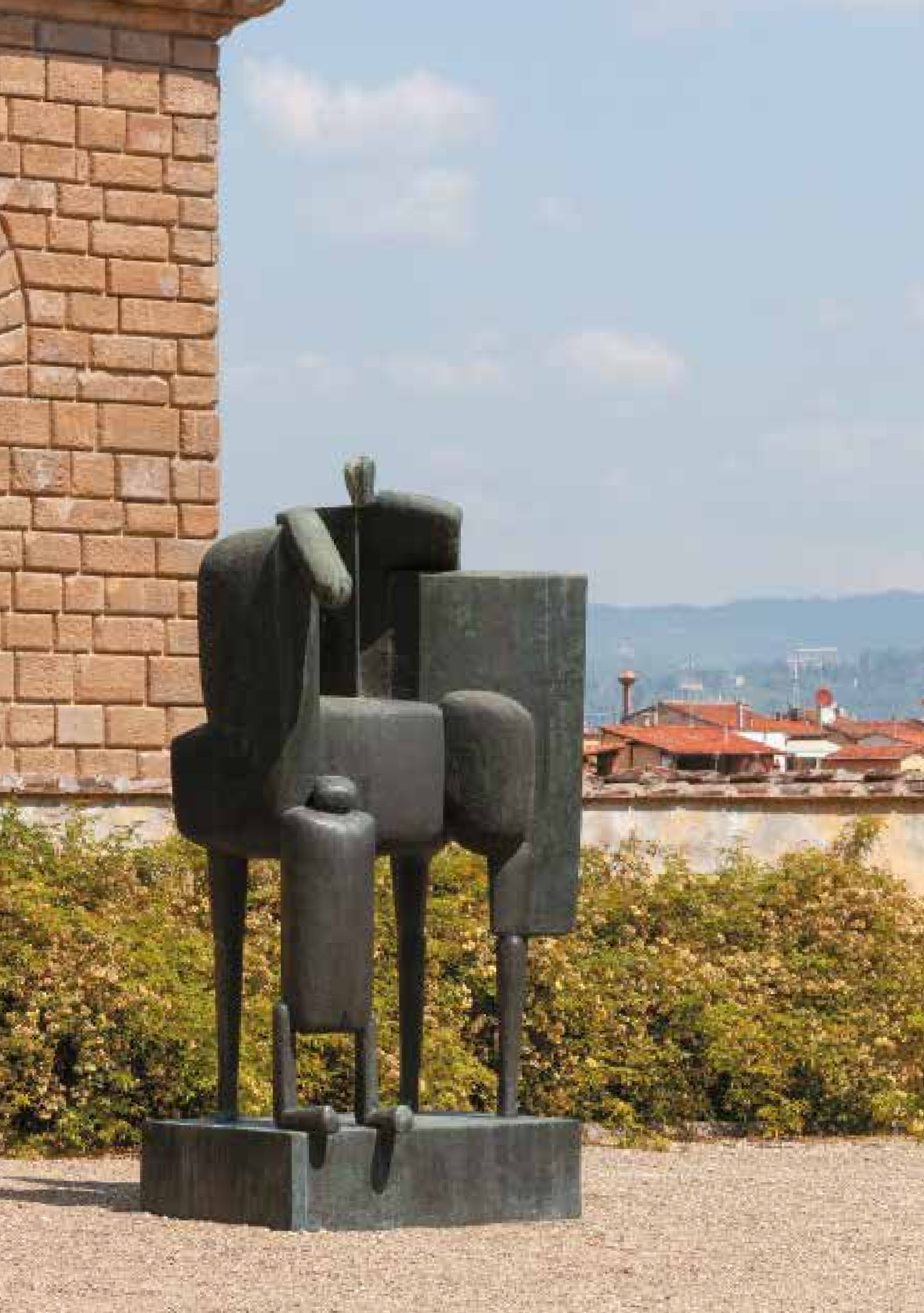
Großer St. Martin Grande San Martino 1963/1964 (24)