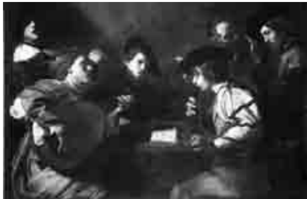
B. Manfredi, Concerto , prima dell'attentato del 1993

Bibliografia di riferimento: Gli Uffizi 1980; Dopo Caravaggio 1987, pp. 68-69