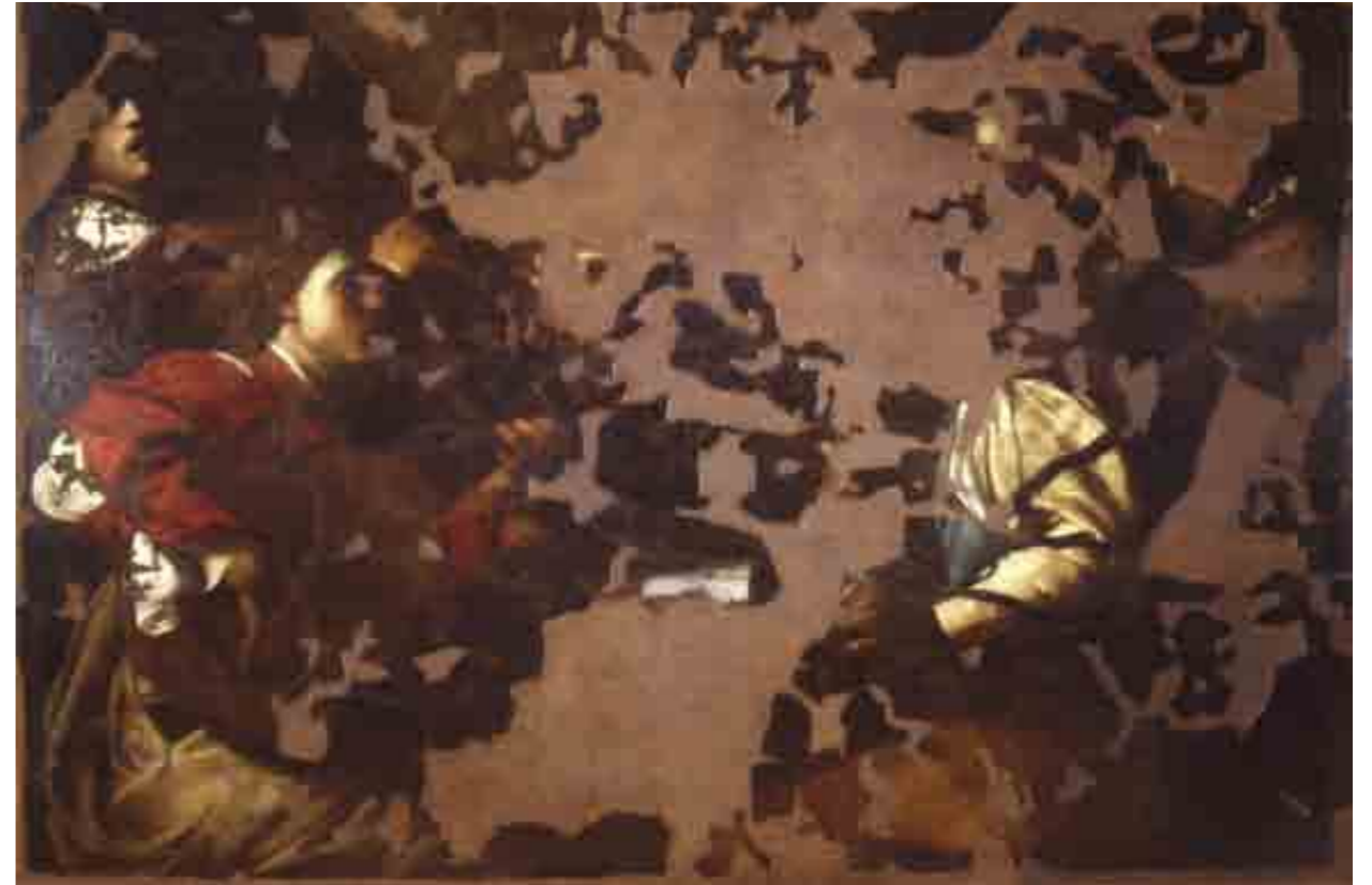
B. Manfredi, Concerto dopo l'attentato di via dei Georgofili e il successivo restauro