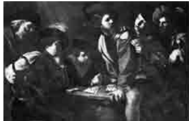
B. Manfredi, Giocatori di carte , prima dell'attentato del 1993, oggi distrutto